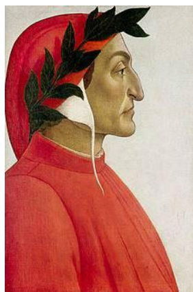
Dante Alighieri door Sandro Botticelli