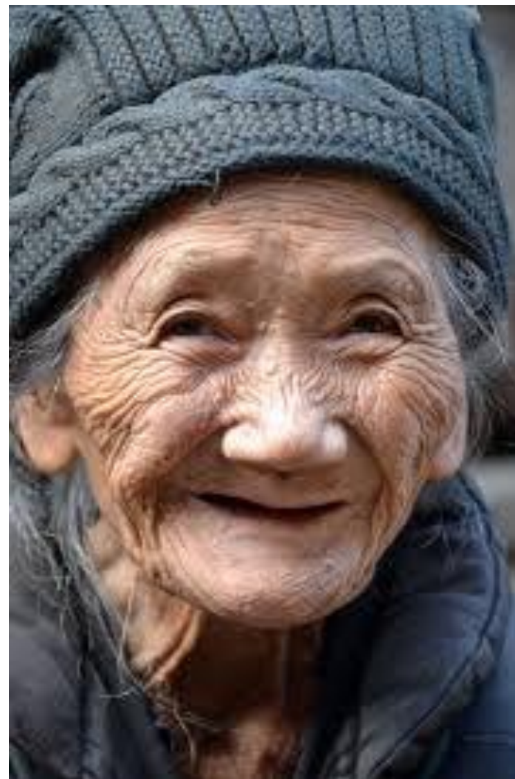
Bijlage mei 2017